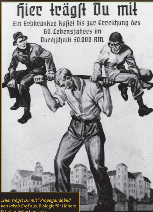
„Hier trägst Du mit“ Propagandabild von Jakob Graf aus: Biologie für Höhere Schulen, München, 1940

Die Ausstellung dokumentiert die Vorgeschichte der „Euthanasie“ bis 1933, die Phase der rassenhygienischen Propaganda und Zwangssterilisation bis zur Bürokratie und Maschinerie des Mordens. Sie beschreibt den Todesweg der Opfer, die Mordzentren, die Haltung der Bevölkerung durch Zustimmung, Gleichgültigkeit oder Protest und sie wirft einen Blick auf den Umgang mit der NS-Vergangenheit und den Tätern, die nach 1945 oftmals unbehelligt blieben.