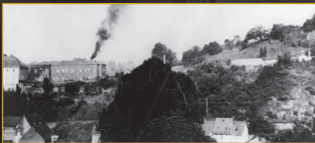
Tötungsanstalt Hadamar mit rauchendem Schornstein (1941)

Zwischen 200.000 und 300.000 psychisch kranke und geistig behinderte Menschen starben zwischen 1939 und 1945 in Gaskammern, durch tödliche Medikamentengabe oder Unterernährung. Darüber hinaus wurden etwa 400.000 Menschen zwangssterilisiert. Unter den Opfern der NS-„Euthanasie“ waren auch Bürgerinnen und Bürger aus der Region: Menschen, die in Waldeck-Frankenberg geboren wurden, hier lebten, in Einrichtungen betreut wurden oder die zwangsweise in Fabriken und auf Bauernhöfen arbeiten mussten. Menschen, die systematisch erfasst und in Hadamar oder in anderen Mordzentren umgebracht wurden.