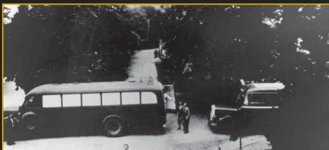
Gekrat-Busse vor der Landesheilanstalt Eichberg