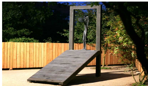
„Auf der Schwelle zwischen Leben und Tod“ von E.R. Nele - im Gedenken an die Opfer des Holocaust aus Waldeck-Frankenberg