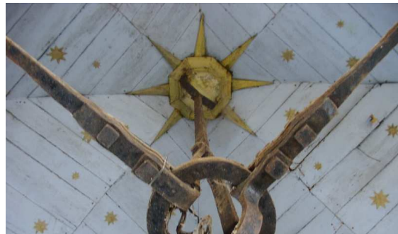
Die Kuppel mit fast 300 goldenen Sternen