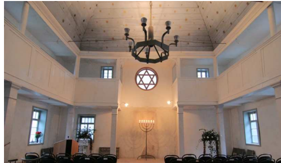
Der renovierte Sakralraum mit originalem Schatten des Thoraschreins und neu gefertigtem Fenster mit Davidstern

Ende 1999 wurde der Förderkreis „Synagoge in Vöhl“ e.V. gegründet. Er erwarb das Haus und restaurierte es.