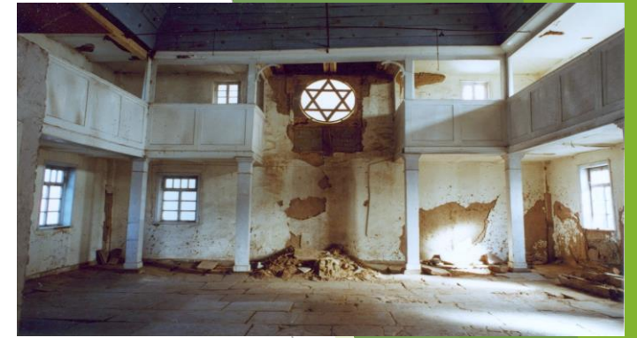
Vor der Renovierung