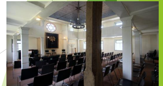
Nach der Renovierung