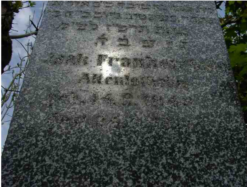
Grabplatte für Isaak Frankenthal auf dem Altenlotheimer Friedhof