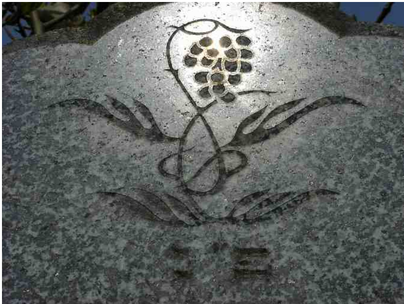
Ornament auf dem Grabstein für Isaak Frankenthal