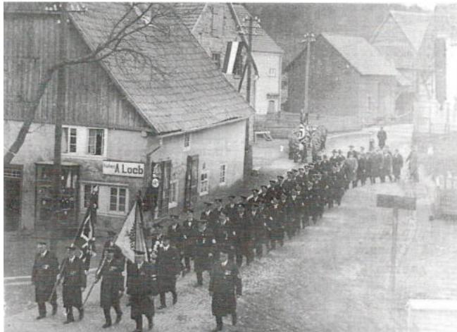
Wrexen, Haus Nr. 4 6

und man habe die schon recht betagten alten Leute gezwungen, ihr gesamtes Hab und Gut auf den LKW zu laden. Niemand habe dabei geholfen. Zuletzt seien die Beiden an Armen und Beinen gefasst worden und zuoberst auf den Anhänger geworfen worden.“ 5