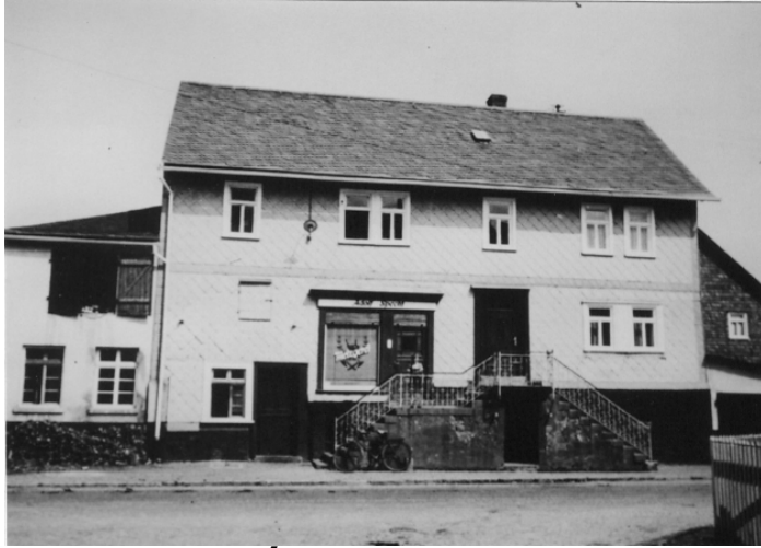
Haus des Isaak Stern 5