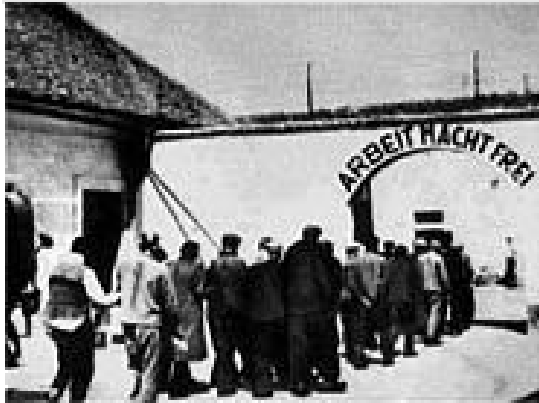
Eingang zur „Kleinen Festung“ in Theresienstadt 10

ren geschlossen, und wir stehen noch stundenlang auf dem Perron. Endlich, gegen 5 Uhr nachmittags, setzt sich der Transportzug in Bewegung. 9