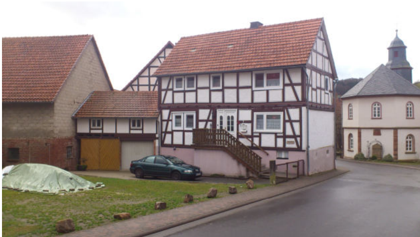
Haus in Altenlotheim 2013 4