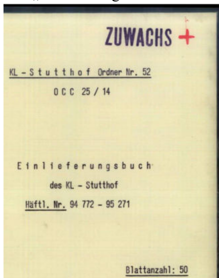
ITS/ARCH/KL Stutthof, Ordner 52 -Deckblatt-

Das „Einlieferungsbuch“ des KL Stutthof nennt den Namen von Ida Straus.