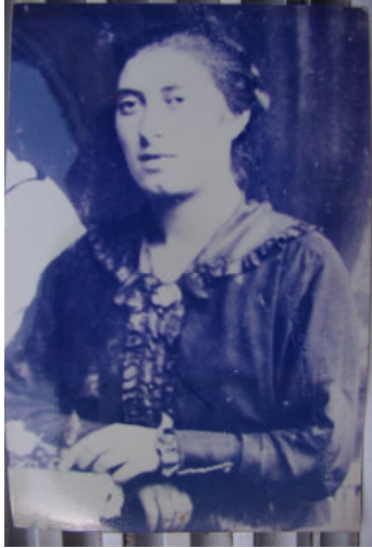
Ida Straus 6