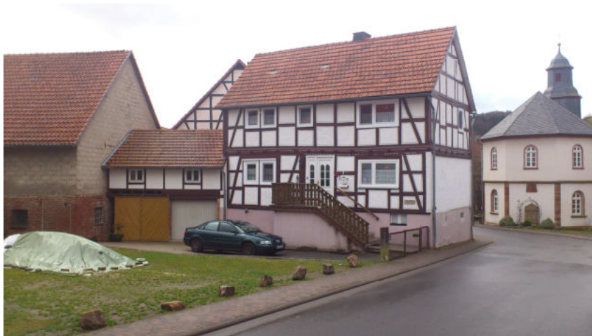
Haus in Altenlotheim 2013 2