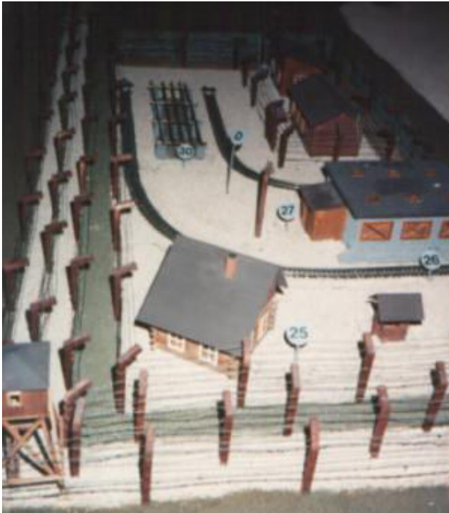
Modell: Tötungsbereich im KZ Sobibor 8

Am Dienstag, dem 1. Juni, wurde Irmgard zusammen mit Schwester Friedel und beider Eltern nach Osten deportiert. Wahrscheinlich am 3. Juni kam der Zug in Lublin an. Die arbeitsfähigen Männer mussten dort aussteigen und wurden nach Majdanek getrieben, während der Zug mit den Frauen, Kindern und alten Männern nach Sobibor weiter fuhr. Wahrscheinlich wurden sie dort innerhalb von 2 Stunden nach ihrer Ankunft vergast. 7