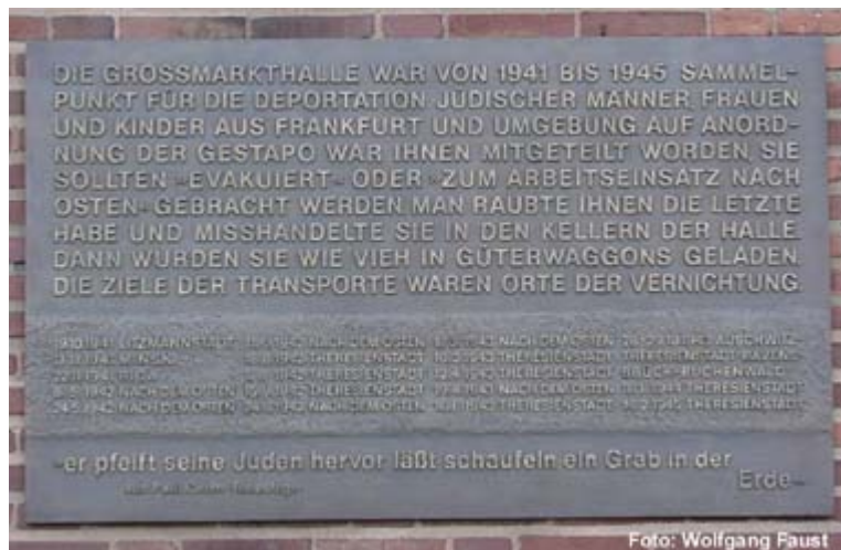
Gedenktafel an der Großmarkthalle 5