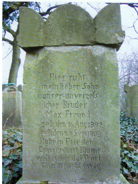
Grabstein auf dem Friedhof in Rhoden 2

Hier liegt begraben ein Knabe, jung [an Jahren]* und gut Mosche, Sohn des Wolf, gestorben und beerdigt den 4. Tischri [5]669. Möge seine Seele eingebunden sein im Bündel des Lebens. * Genesis