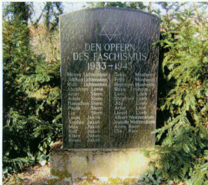
Gedenktafel auf dem Friedhof in Rhoden 5