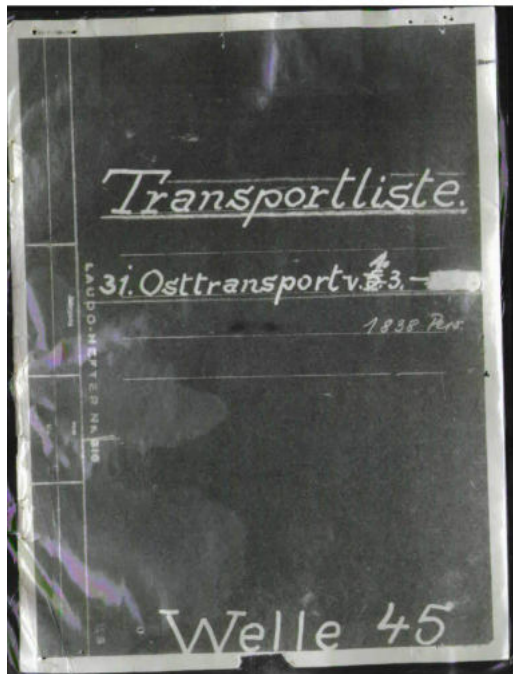
Copy in conformity with the ITS archives

Die folgenden Kopien aus der Transportliste stellte der Internationale Suchdienst in Bad Arolsen zur Verfügung.