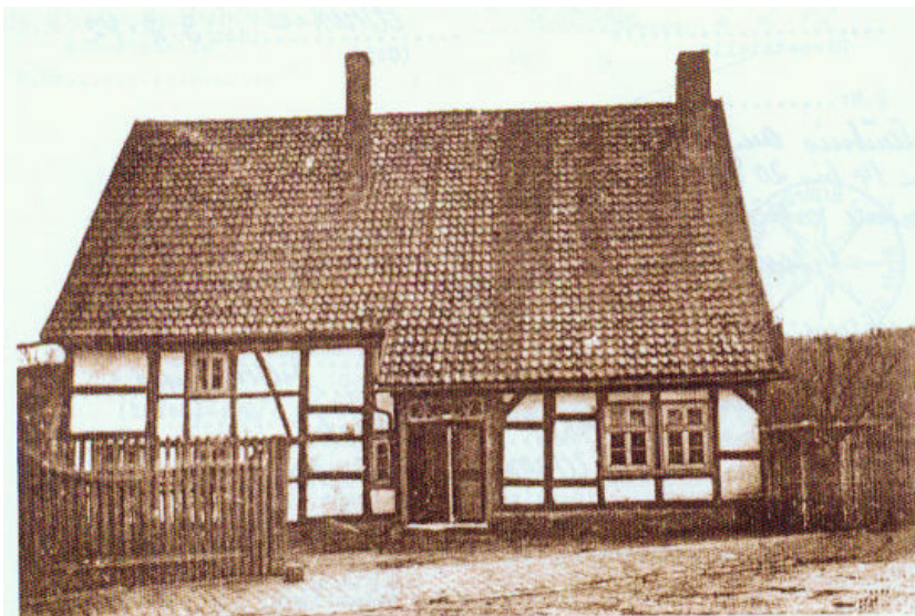
Haus Nr. 5 in Wrexen 3

Wie wir wissen, wurden – allerdings einige Monate später – auch Günter Sternberg und nach Zeugenberichten einen Tag danach auch seine Eltern zunächst nach Wrexen gebracht. Dort wohnten sie im Haus Nr. 5, dem Haus des Land- und Gastwirts Hugo Kruse 2 .