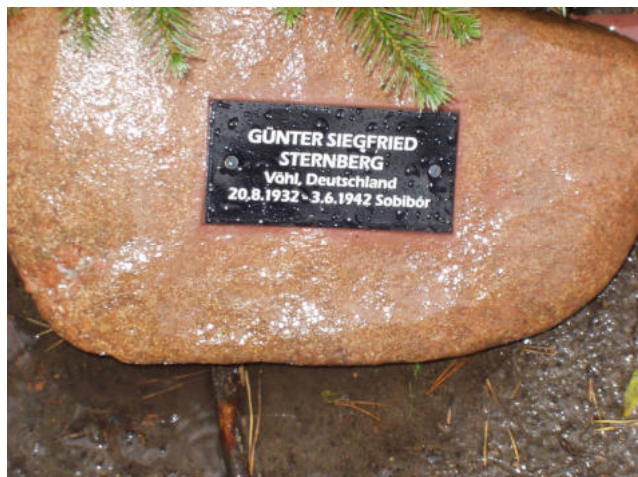
Stein in der Gedächtnisallee Sobibór 9