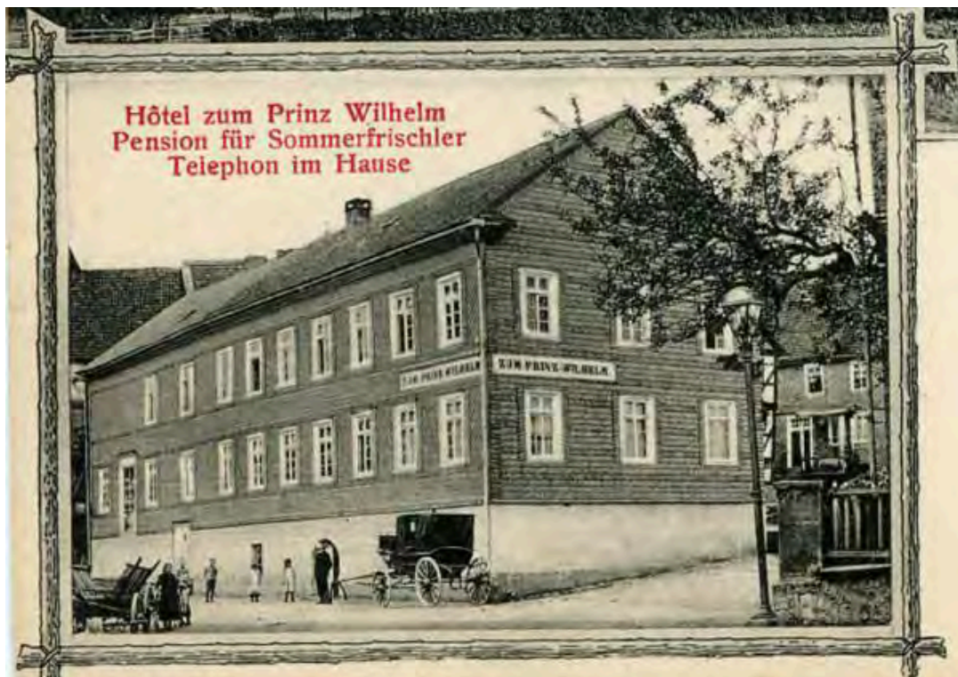
Abbildung 1 Hotel "Prinz Wilhelm", Geburtshaus von Selma R.

Haus No 10 in der Arolser Straße, ab ca. 1920 Bäckerei im Besitz der Familie Naumann, später Schwarz.